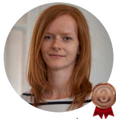
Chropyňská strojírna, a.s.

Vystudovala jsem angličtinu a ruštinu, v průběhu dvou let jsem žila ve čtyřech zemích a komunikaci považuji za základní kámen všech typů vztahů. V mluvení jsem minimalista - ráda lidem spíše naslouchám. Poznávat jiné lidi a jiné kultury je totiž nejen zajímavé, ale hlavně obohacující. Jsem proto moc ráda, že jsem se dostala mezi skvělé kolegy a odborníky. Do Chropyňské jsem nastoupila do rozjíždějícího se vlaku naší nové divize, kde bylo potřeba rychle a efektivně zajistit hladký rozjezd. I když se rozrůstáme, umíme se postarat jeden o druhého. Takové práce si umím vážít a ve své podstatě mi plní hned několik snů - člověk si připadá, že má vlastní jazykovku, cestovní agenturu, kavárnu, kreativní eventovou agenturu i kancelář v jednom. Díky kolegyním a multisportce jsem také začala pravidelně sportovat. Mimo to si ve volném čase s chutí přečtu zajímavou knihu a něco dobrého uvařím.