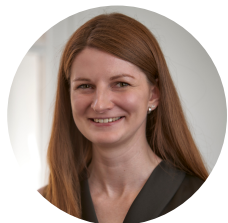
SIRIUS FINANCE, a. s.